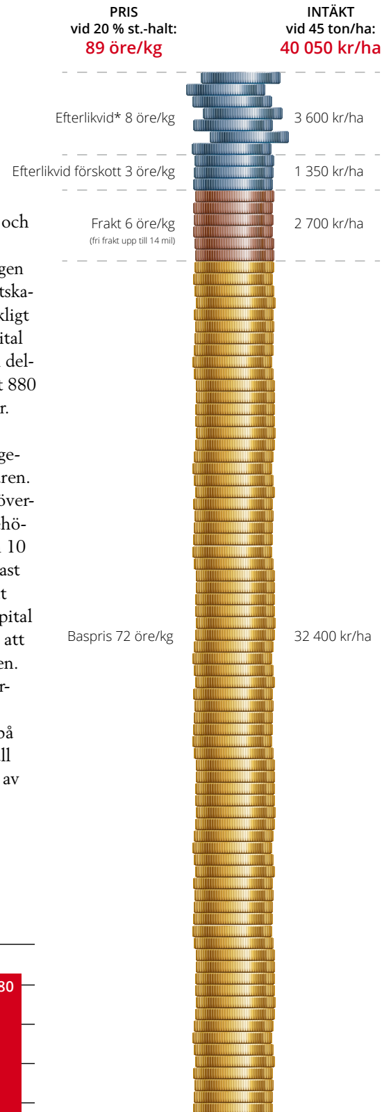
Betalning 2020, öre/kg, vid olika stärkelsehalter

Kravet om två potatisfria år kvarstår. Vi är helt övertygade om att det på sikt är gynnsamt att dra ut på växtföljden, för att vi framöver skall nå en hållbar och långsiktig odling av stärkelsepotatis.